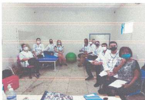
Troca de casos com outro setor