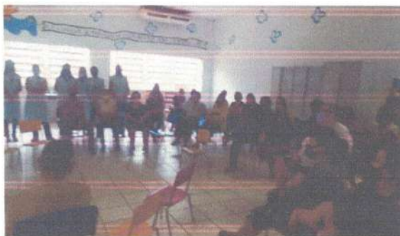
Reunião com membros familiares