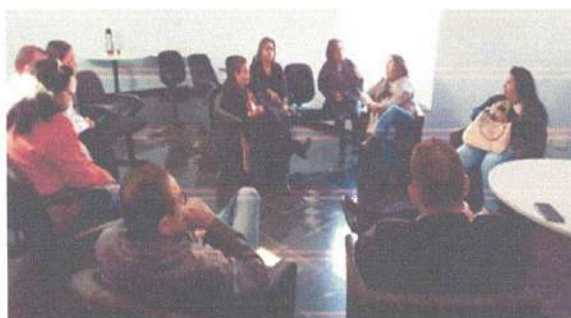
Reunião de equipe interdisciplinar com a presença do Conselho Tutelar