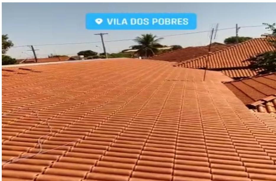
Início da implantação preparação do telhado