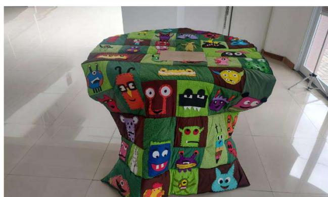
Exposição dos trabalhos realizados em 2022 – Grupo: Artes em Tecido