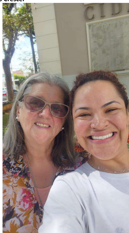
Nomeação de Usuária como Representante dos usuários da rede SUAS do Conselho Municipal da Assistência Social (CMAS)