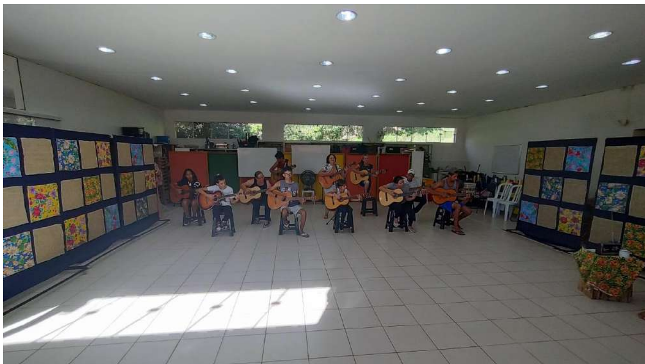
Grupo: Violão – Osc Espaço Crescer