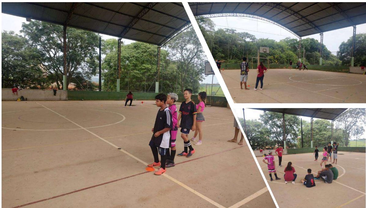
Grupo: Futsal – Quadra E.E. Constantino – Br: Boa Vista