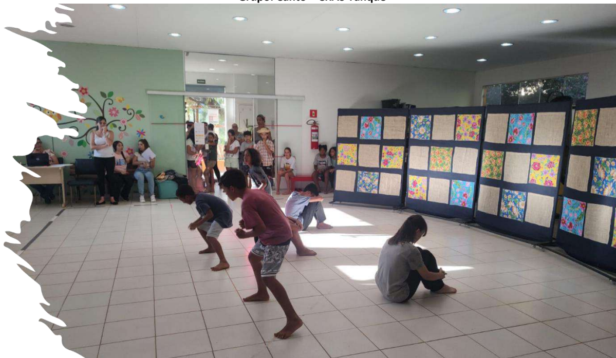
Grupo: Capoeira – Osc Espaço Crescer