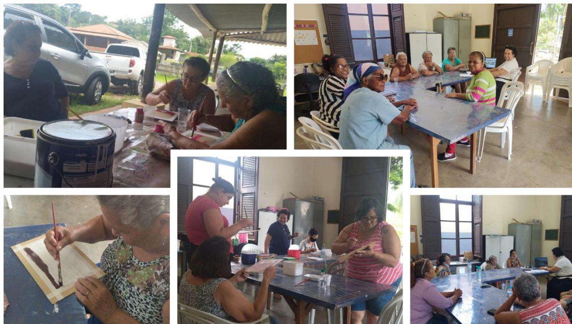
Grupo: Artesanato – CRAS Tanque| Cachoeira