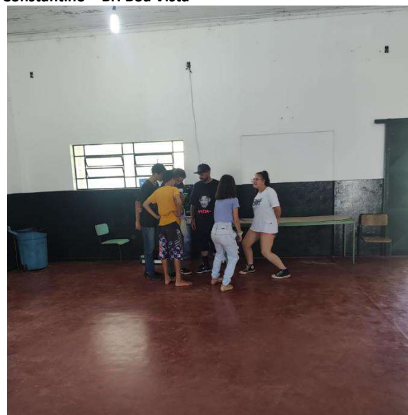
Grupo: Hip Hop – Centro Comunitário – Br: Boa Vista