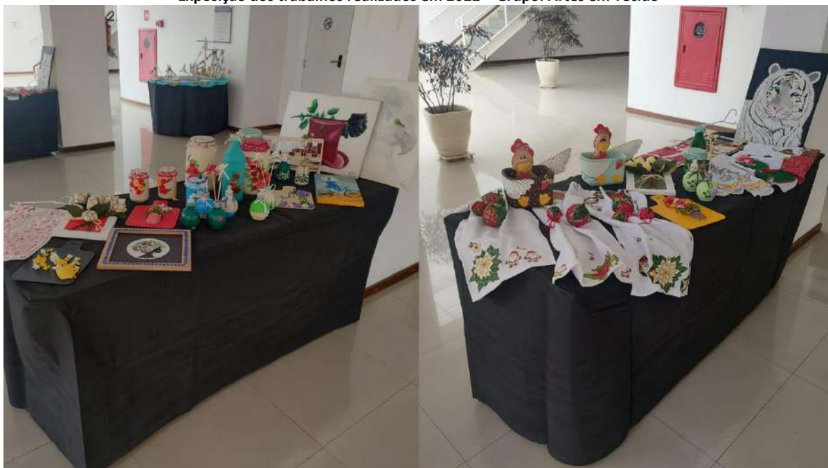
Exposição dos trabalhos realizados em 2022 – Grupo: Artesanato