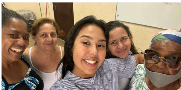
Grupo: Canto – CRAS Tanque