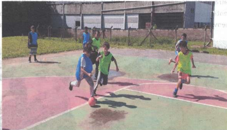
Número de alunos atendidos: 100

Objetivo da atividade: Desenvolver aptidões de resistência, força, velocidade, ritmo, senso de coletividade e equipe, entre outras, de forma lúdica e prazerosa para a criança; promover a consciência e a expressão corporal, a autoestima, desenvolvendo a confiança em si mesmo melhorando habilidades motoras, sociais e pessoais; auxiliar no desenvolvimento integral das crianças.