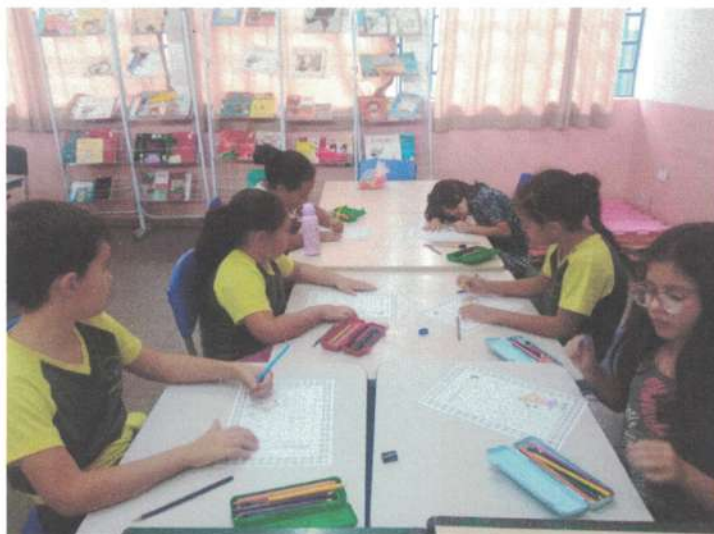
Alunos(as) atendidos(as): 64

Objetivo da atividade: Aprofundar os conhecimentos matemáticos através da resolução de problemas, incluindo problematizações de jogos, uso de materiais concretos, novas tecnologias e projetos. Pretende-se desenvolver no aluno a capacidade de resolver problemas, estimulando para tanto, a curiosidade e o espírito investigativo através de atividades lúdicas e desafiadoras.