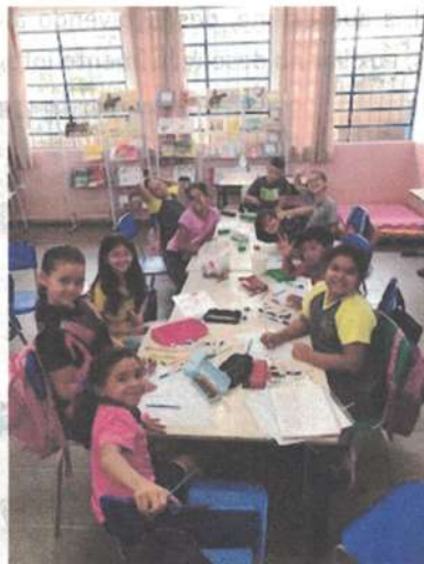
Alunos atendidos: 75