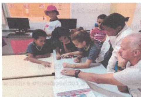
Número de alunos atendidos: 160 alunos