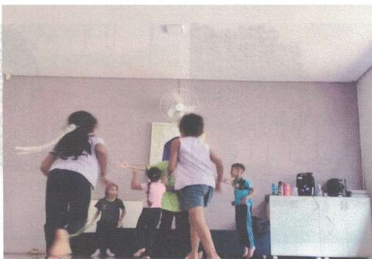
Alunos(as) atendidos(as): 85

Objetivo da atividade: Promover um espaço lúdico, onde as crianças possam vivenciar momentos de criação artística e expressão corporal. Um dos principais objetivos da cultura hip hop é a promoção da resolução de conflitos através da arte, incluindo a música (rap), a pintura (grafite) e a dança. Essa atividade propõe, de forma pacífica, a reflexão sobre a igualdade na diversidade, o bullying e outras formas de discriminação e violência.