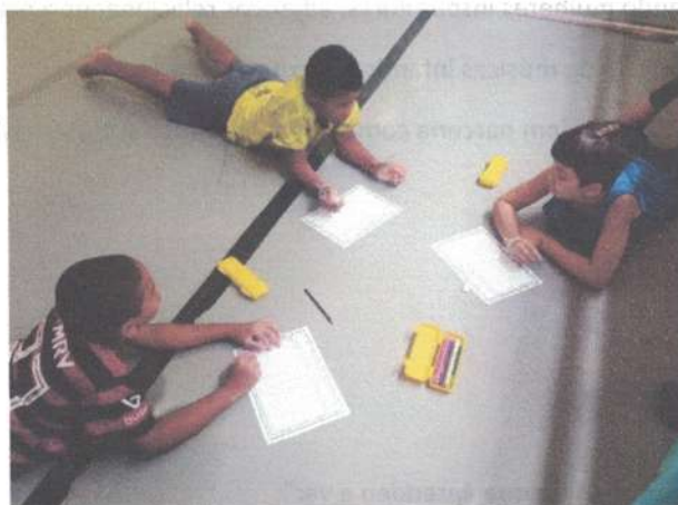
Alunos(as) atendidos(as): 132

Objetivo da atividade: Aprofundar os conhecimentos matemáticos através da resolução de problemas, incluindo problematizações de jogos, uso de materiais concretos, novas tecnologias e projetos. Pretende-se desenvolver no aluno a capacidade de resolver problemas, estimulando para tanto, a curiosidade e o espírito investigativo através de atividades lúdicas e desafiadoras.