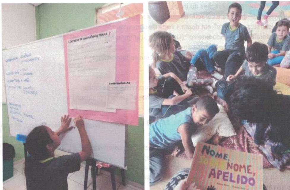
Alunos(as) atendidos(as): 160

Objetivo da atividade: Promover desenvolvimento da linguagem oral permitindo às crianças o exercício das narrativas, tomando o contato com diversos gêneros literários (poesia, fábulas, contos de fadas, entre outras); estimular a leitura favorecendo na criança a aquisição de novos conhecimentos, bem como a vontade de aprender.