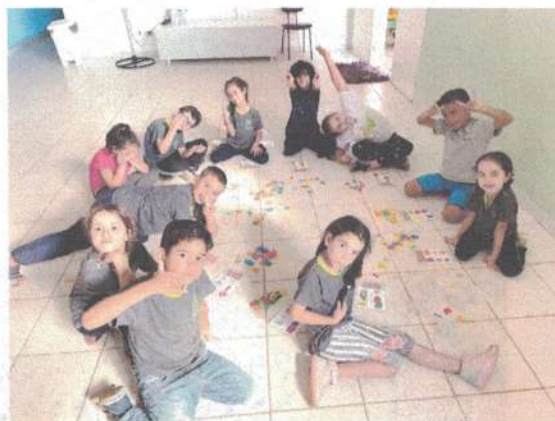
Alunos(as) atendidos(as): 28