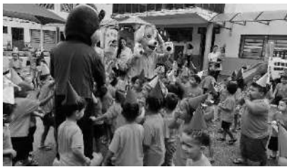
No pátio interno com a Patrulha canina