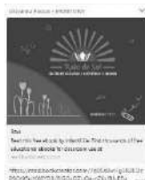
Exemplo do link que os pais receberam em seu celular.

Uma novidade deste semestre, foi o envio, via WhastApp , do link de acesso ao portfólio individual de cada aluno.