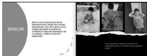
Um exemplo das páginas internas do portfólio.

Foi um enorme trabalho da equipe docente e da gestão pedagógica para a elaboração e revisão dos portfólios, bem como da secretária para cadastrar todos os pais e enviar o documento. Contudo, o retorno não demorou a vir. Na sequência, alguns comentários dos pais, após terem visto o portfólio de seu(sua) filho(a):