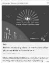
Exemplo do link que os pais receberam em seu celular.

Páginas introdutórias do portfólio que não eram iguais para todas as turmas, pois este documento também retrata a particularidade de cada educadora.