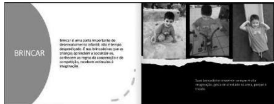
Um exemplo das páginas internas do portfólio.

Páginas introdutórias do portfólio que não eram iguais para todas as turmas, pois este documento também retrata a particularidade de cada educadora.