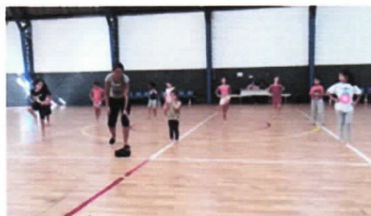
Polo Ginásio Rolando Rolli