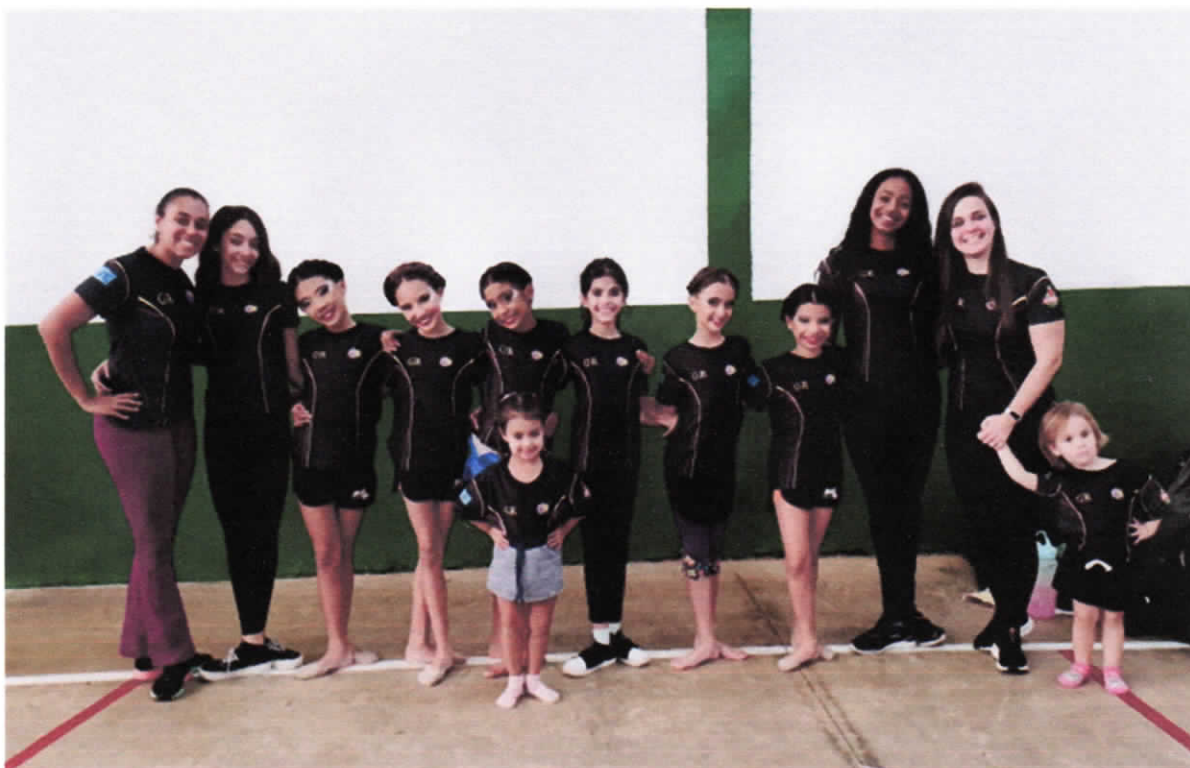
Entrega das camisetas para as(os) atletas do Polo Central no dia 22/06