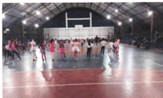
Polo Cido Franco 04/08/2023 – Cecília Hernandes