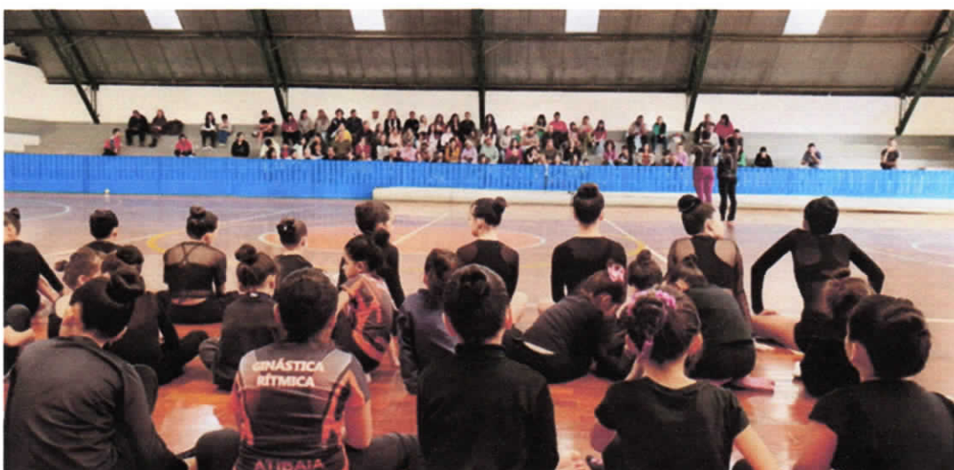
Reunião e encerramento do semestre no dia 22/06