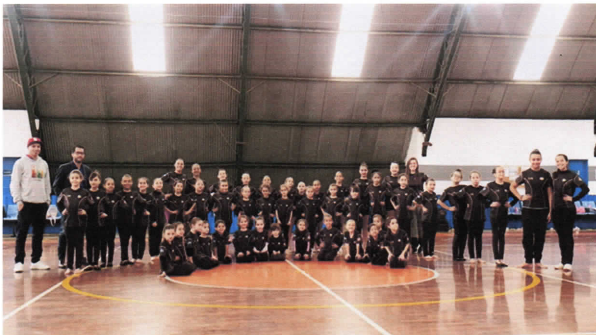
Entrega das camisetas para as(os) atletas do Polo Central no dia 22/06