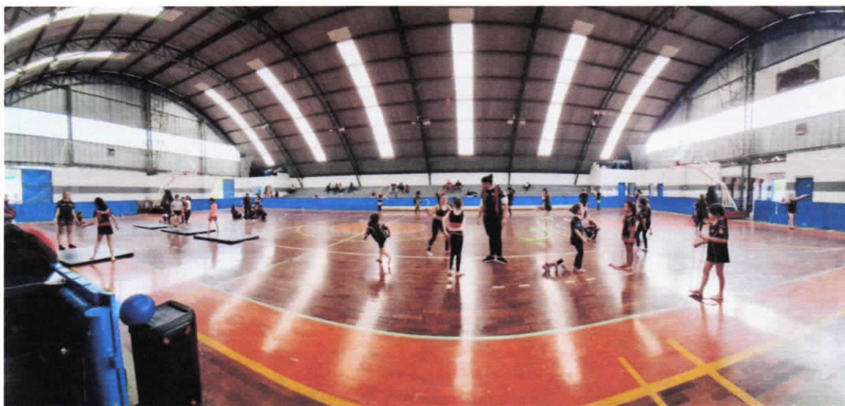
Ginásio Elefantinho – Larissa Spinelli - agosto / 2023