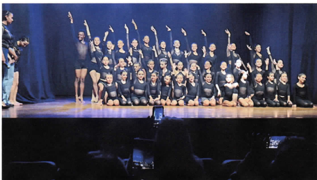
Apresentação de Gala no dia 14/06 no Cine Itá