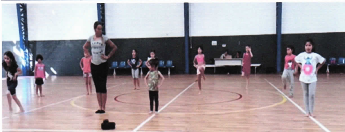
Atividades nos Polos de Iniciação CIEM 1 e Rolando Rolli no mês de maio