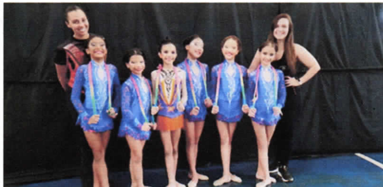
Competição de cordas dia 28/05 em Americana