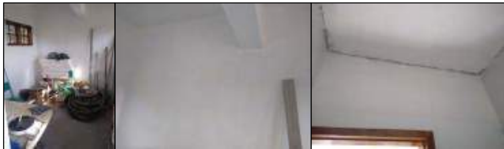
Figura 11 - Interior da Casa do Fogo com materiais dos pedreiros e pinturas a serem feitas.

Na área interna faltam acabamentos da pintura nos cantos superiores e mais uma camada de tinta. O local conta com objetos dos pedreiros da obra (figura 11).