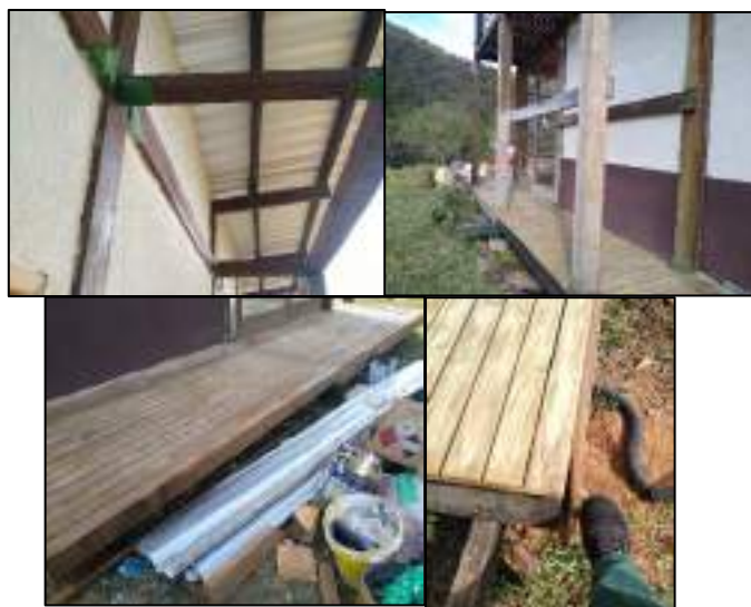
Figura 1 - Madeiras necessitando de manutenção na área externa do CAVGF.

Na área externa do prédio principal do CAVGF, foram encontradas madeiras deslocadas que não foram rearranjadas e outras que não foram retiradas, as madeiras do deck externo do CAVGF também necessitam de manutenção, conforme Figura 1, assim como há trechos de pintura mal acabados e é neste perímetro que ocorre acúmulo dos entulhos (Figura 2)