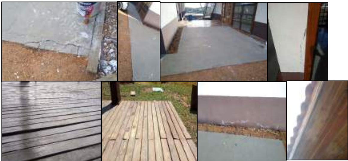
Figura 9 - Estruturas já danificadas ou com avaria no exterior do prédio Conveniência e deck.

O deck que liga a Conveniência ao Banheiro apresenta desníveis na madeira e o forro apresenta madeiras soltas no acabamento. O paisagismo não foi realizado, as imagens desta região são apresentadas na Figura 9 seguir.