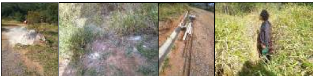
Figura 12 - Restos de materiais, descarte irregular de tinta e valeta aberta no exterior da Casa do Fogo.

Na área externa também se observa entulhos e materiais da construção, além de restos de tinta jogado pelos pintores, um conduíte no chão sem passagem aparente de fio e uma vala com mais de 1m de altura onde um membro da equipe já se acidentou, na figura 12 a seguir é possível mensurar.