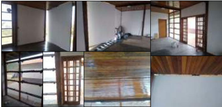
Figura 6 - Acabamentos de portas e paredes a serem finalizados, peças faltantes e manutenções de janelas e teto não realizadas no interior do prédio do CAVGF.

aberturas em fendas nas madeiras, que ocorreram devido ao vazamento de água da calha antiga. Na nova porta de correr há um acabamento ao redor não feito. Na parte superior dos painéis ficou um espaçamento considerável entre o teto e o painel, possibilitando a entrada de fauna (aves, insetos, etc.). Os locais comentados são apresentados na Figura 6.