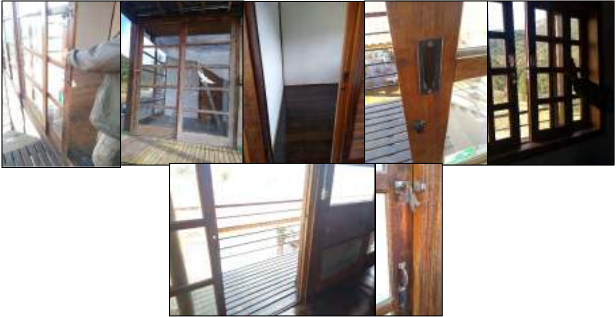
Figura 4 - Portas, janelas e fechaduras não reformadas ou com acabamentos pendentes do CAVGF.

Na cozinha a pia e torneira não foram instaladas até o momento, e os espelhos dos interruptores também não foram colocados, assim como há um objeto não identificado saindo do teto, antigo ponto que estava a luminária. Em um dos quartos o interruptor está com pouca mobilidade, enquanto no banheiro o registro geral não foi instalado, não há chuveiro, que também não apresenta fio terra, e a pia do banheiro apresenta mal acabamento na saída do cano (Figura 5).