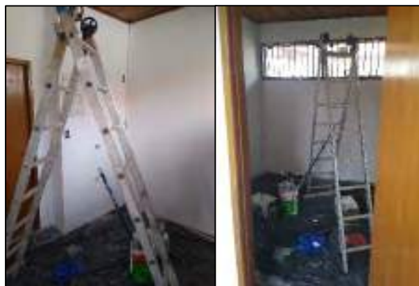
Figura 7 - Espaço destinado à copa em processo de pintura, sem peças hidráulicas instaladas.

Na copa a pintura está sendo realizada no referente período que este relatório é escrito, faltando instalar a pia e torneira que servirá à copa, realizar acabamentos e verificar a qualidade dos vidros (Figura 7).