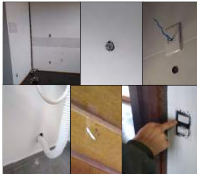
Figura 5 - Peças faltantes de elétrica e hidráulica no piso superior do CAVGF, interruptor com defeito e objetos não identificados no teto da cozinha.

Na cozinha a pia e torneira não foram instaladas até o momento, e os espelhos dos interruptores também não foram colocados, assim como há um objeto não identificado saindo do teto, antigo ponto que estava a luminária. Em um dos quartos o interruptor está com pouca mobilidade, enquanto no banheiro o registro geral não foi instalado, não há chuveiro, que também não apresenta fio terra, e a pia do banheiro apresenta mal acabamento na saída do cano (Figura 5).