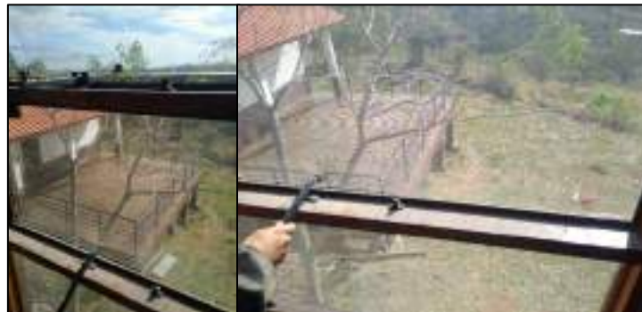
Figura 3 - Janelas de vidro no piso superior do CAVGF sem manutenção.

Não houve instalação, nem previsão de instalação, das placas fotovoltaicas e de estruturas para estacionamento. Há a necessidade de fechamento do vão entre o telhado e o vão da nova parede que ficou com aberturas devido ao desenho da telha, evitando assim a entrada da vida silvestre. Na parte interna do piso superior, as janelas de vidro não fecham e não passaram por manutenção (Figura 3).