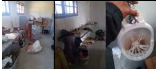
Figura 10 - Materiais no interior dos banheiros e mictório com pouco vazão de água.

Ambos apresentam materiais da equipe cogestora e dos trabalhadores da obra, a água que sai dos canos com pouca pressão, sendo a do mictório consideravelmente de baixa vazão, enquanto as janelas não possuem reforços com tranca e são facilmente obstruídas (Figura 10).