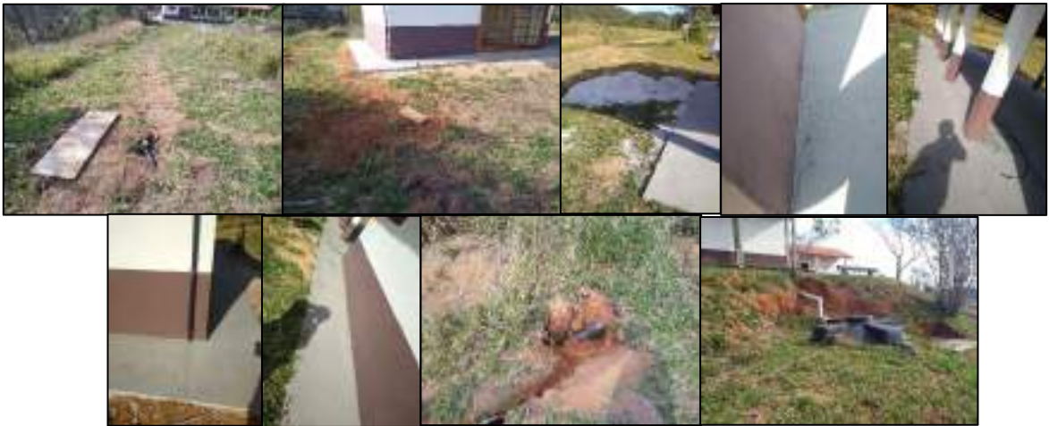
Figura 13 - Instalações faltantes, restos de materiais e danos na área externa do Viveiro.

Na área interna existe apenas um local com 2 pontos de tomada (mesma caixa com 110V e 220V) e não há quadro de distribuição com disjuntores de segurança no local. Na área externa (Figura 13) vemos onde não foram instaladas as caixas de inspeção, há resto de materiais da obra e a estrutura apresenta rachaduras em diversos pontos do exterior do galpão e da rampa de acesso. O encanamento antigo danificado durante a execução da obra, pela empresa contratada, permaneceu no mesmo estado. No biodigestor não foi realizado a recuperação do barranco para cobrir o cano hidráulico.