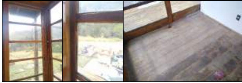
Figura 8 - Entrada principal do CAVGF sem pinturas nas madeiras e manutenção nos vidros.