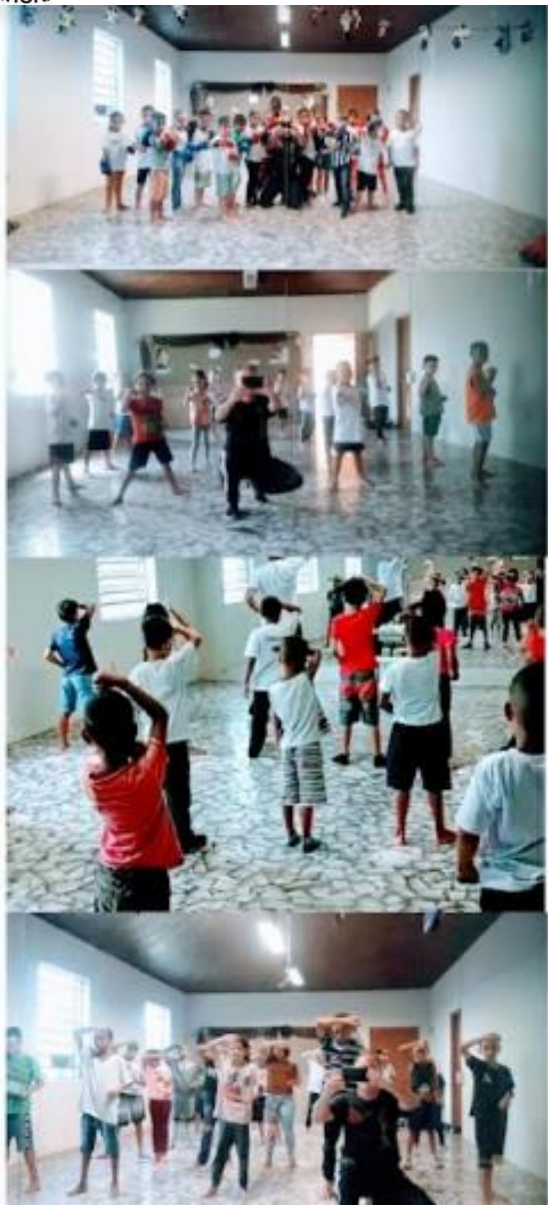
Janeiro / Fevereiro / Março – Atividades extras (Sarau / Teatro / Passeio)

Estrada Municipal AMP 161 Simão de Oliveira Bairro do Martírio – KM 45 – Rodovia João Beira Amparo/São Paulo / CEP: 13.905.412/ Caixa Postal 168 Tel. (19)3807-4129 – 19.9.9708-0677 / E-mail: educandario.cedo@gmail.com CNPJ 43.467.224/0001-10