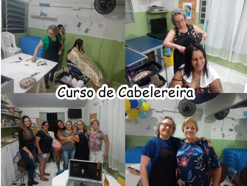
Curso de Cabelereira

RUA DONA RITINHA, Nº 5 - CEP 13900-170 - AMPARO - ESTADO DE SÃO PAULO - FONE: (19) 3807-3004