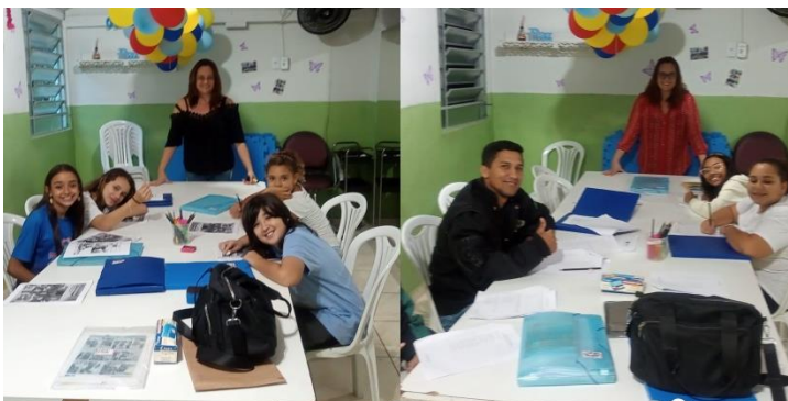
Conversação em Inglês