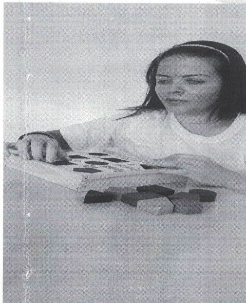
Figura 1- Atividades de Jogos adaptados,