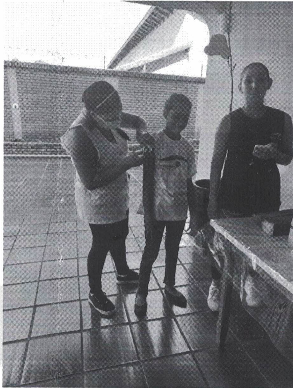
Figura 3- Passeata 18 de Maio