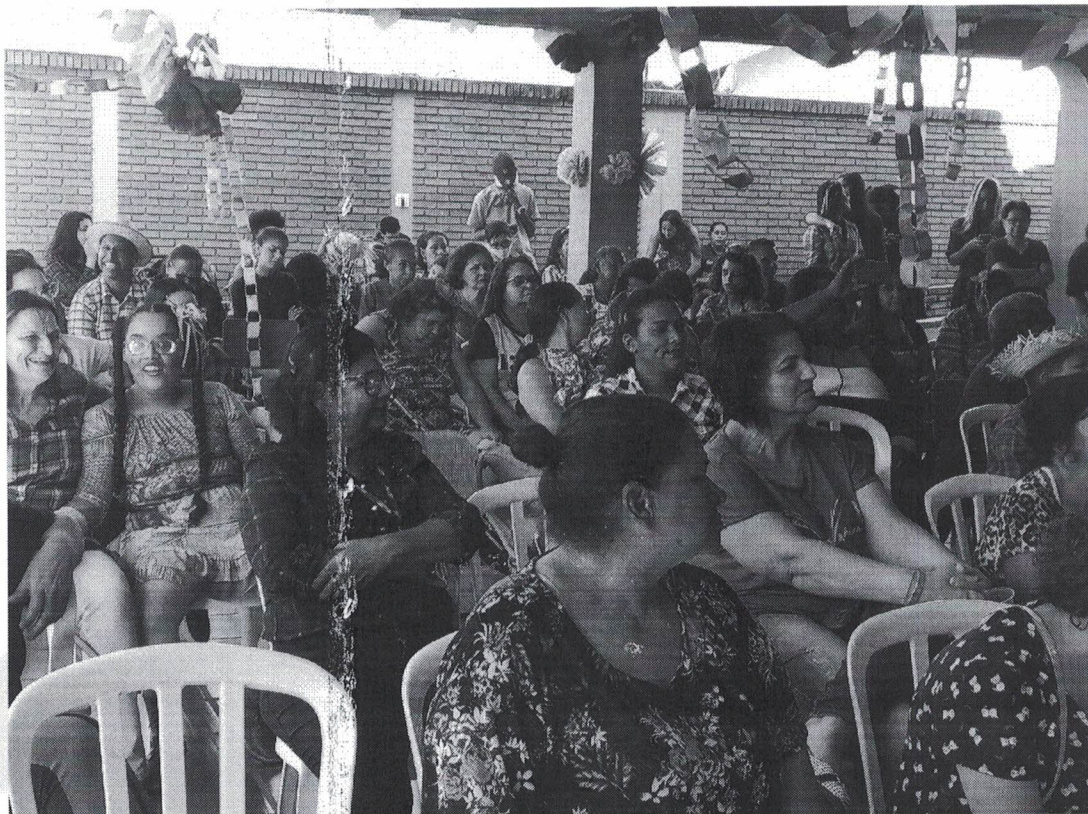
Figura 4- Festa junina na Instituição

Unidade de Atendimento à Pessoa com Deficiência Visual