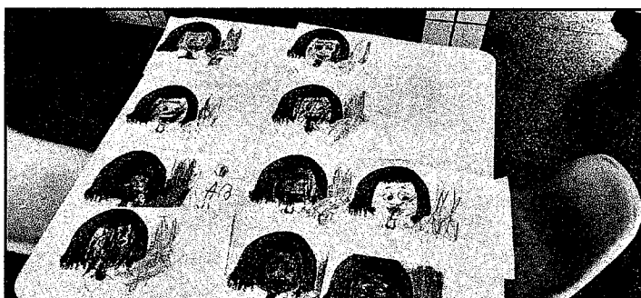
Atividades desenvolvidas nas salas de aula com o Tema Consciência Negra