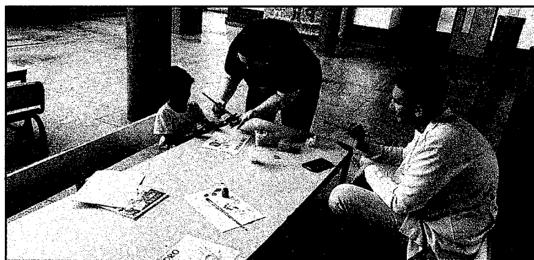
Projeto Lavar as Mãos – Palestra e atividades desenvolvidas com os estudantes do curso de Medicina da Faculdade