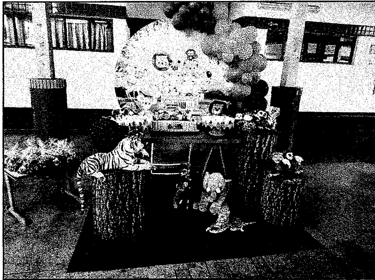
Festa do Dia das Crianças, parceria com Ordem de Demolay. Salgados, bolos, guloseimas, brinquedos infláveis e decoração temática