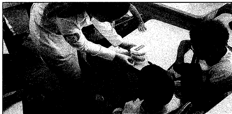
Palestra sobre Saúde Bucal com os estudantes da Faculdade de Medicina