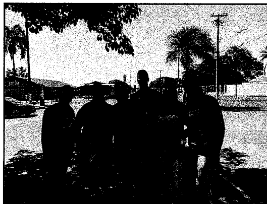
Caminhada Passos que Salvam - Parceria com o HA