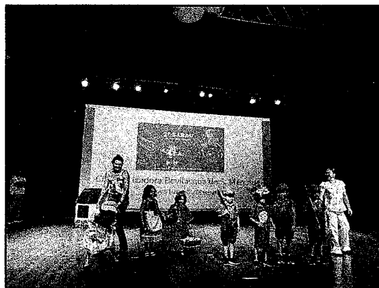
Apresentação do Sarau com o Tema Chapeuzinho Vermelho