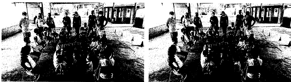
Imagens (acima) do Café da manhã oferecido em comemoração do Início do Ano Letivo.

Endereço: Av. Jorge Tibiriça,105 – Distrito do Ibitu – Barretos / SP – CEP: 14.789-055 E-mail: cemeimpcatarino@gmail.com