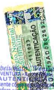
Tabela de Valores Tabela: VALTER VENTURA - R. ... 97-Valinhos/SP - AUTENTICACÃO Autentico a presente cópia da ... traída nestas notas, a qual confere ... do fé. SELOS PAGOS 11 OUT. 2018 POR VERBA Gabriel Dini Roscio - Escr. AUL. Valor recebido pela autenticação R$ 3,52 VÁLIDO SOMENTE COM SELO DE AUTENTICACÃO

ASSOCIAÇÃO CULTURAL, EDUCACIONAL, SOCIAL E ASSISTENCIAL - A.C.E.S.A. Capuava Registrada no Registro Privativo de Pessoas Jurídica de Campinas sob nº 189597, em 23.08.2002. Utilidade pública pela Lei municipal nº 4095 de 06/03/2007 e pela Lei estadual nº 15.453 de 09/06/2014. Inscrita no Conselho Municipal de Assistência Social (CMAS) de Valinhos sob nº E07. Inscrita no Conselho Municipal dos Direitos da Criança e do Adolescente de Valinhos (CMDCA) sob nº E01. Certificado de Regularidade Cadastral de Entidades (CRCE) da Secretaria de Governo do Estado de São Paulo nº 2665/2012. Certificado de Entidade Beneficente de Assistência Social - CEBAS (validade: 01/04/2018 a 31/03/2023). CNPJ 05.332.435/0001-57