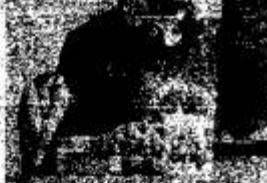
Inscrições e provas são feitas

Ao término da inscrição, o candidato estará apto a iniciar a prova on-line, mediante login e senha cadastrada durante a inscrição. Ao entrar no sistema de acesso à prova, receberá via SMS ou e-mail o código de confirmação para liberação do